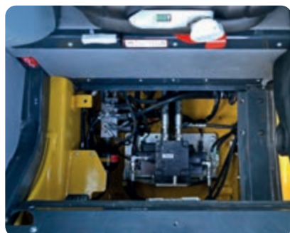
Grazie al cofano all'interno della cabina, la manutenzione straordinaria della valvola principale può essere eseguita rapidamente senza ribaltare la cabina