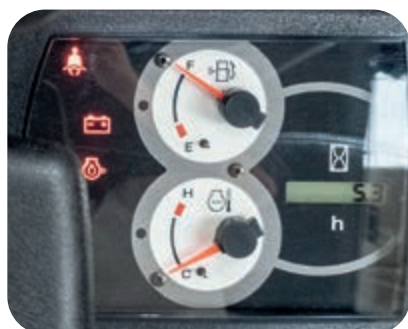
Indicatore cintura di sicurezza sedile sul cruscotto