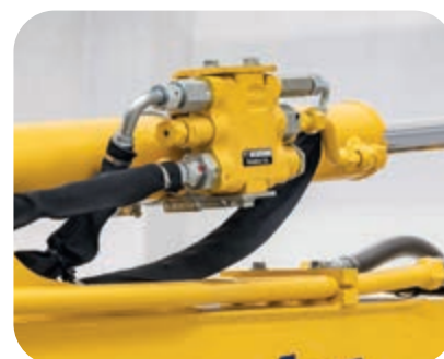
Valvole di sicurezza cilindri braccio e avambraccio