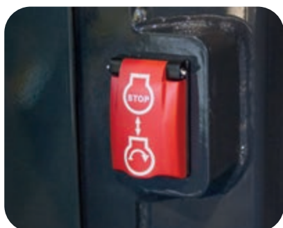
Interruttore secondario di arresto motore