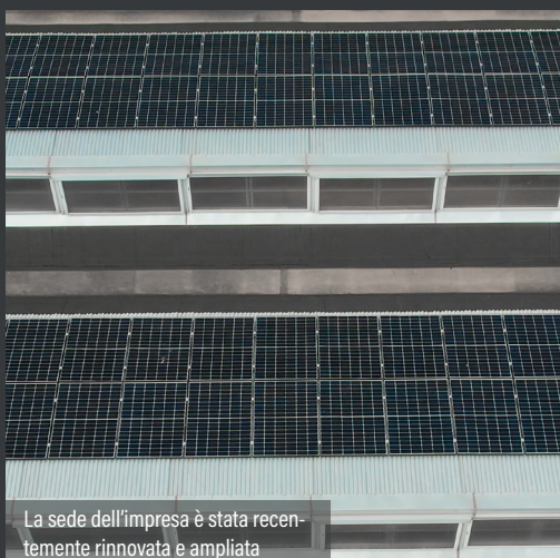
La sede dell’impresa è stata recentemente rinnovata e ampliata