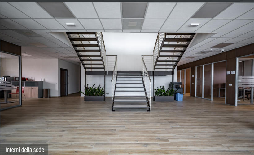
Interni della sede