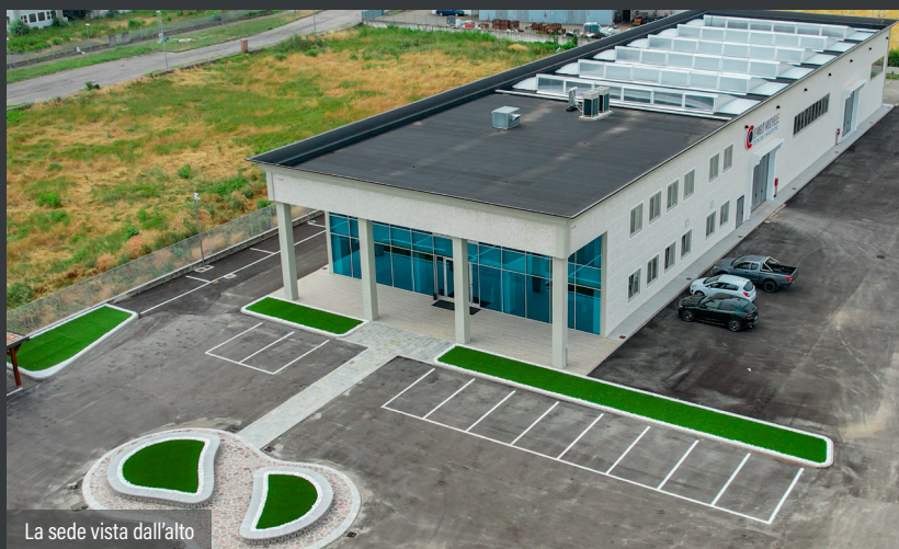
La sede vista dall’alto