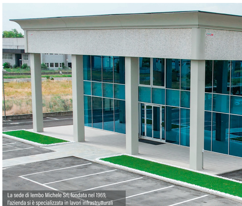
La sede di Iembo Michele Srl, fondata nel 1969, l'azienda si è specializzata in lavori infrastrutturali

“ Io, mia sorella e mio fratello, siamo la seconda generazione. Portiamo avanti la passione condivisa con nostro padre, il fondatore. ”