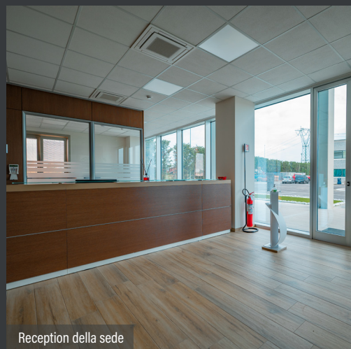
Reception della sede